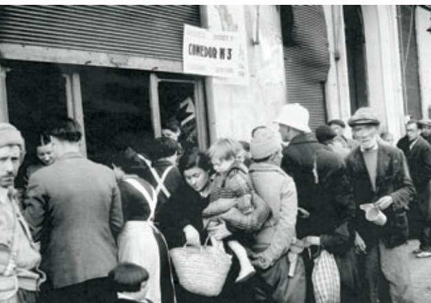
La cartilla de racionamiento y las colas para pedir comida fueron imágenes habituales en la posguerra murciana.